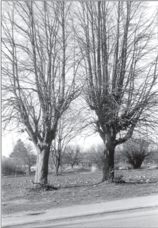
Efter rivningen står de två vårdträden kvar.

lades ner. Ett nytt sätt att sälja varor hade kommit från Amerika, man kallade det för snabbköp. I dessa affärer kunde kunden själv hämta sina varor och lägga dem i en vagn och sedan vandra till en kassa för att betala. I Hörby öppnades den första affären av detta slag i slutet av 1950-talet. Många handlare dömde snabbt ut affärsmetoden. Men de hade fel, kunderna fann sig till rätta i snabbköpet och lämnade det hittills traditionella sättet att köpa sina varor över disk. Den ena speceriaffären efter den andra lades ner.