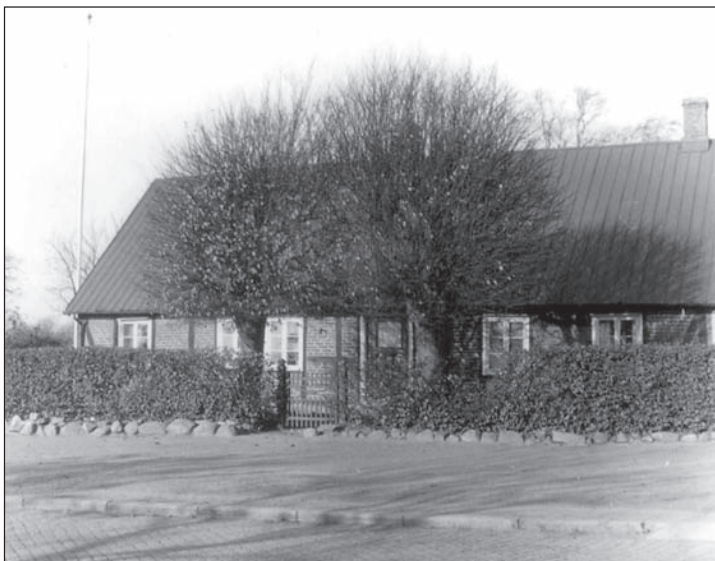
Huset på Kristianstadsvägen 44 på 1950-talet.

Bakom en gammal bokhäck och två stora dominerande vårdträd av lind ligger en gammal av vildvin och murgröna beklädd korsvirkesbyggnad inbäddat i grönska och omgiven av blomsterrabatter och gräsmattor. Det är ej någon modern trädgårdskonst som här firar triumfer, utan gammal hemtrevnad som skymtar fram ur rabatterna och buskarnas gömslen, och som gör stället så tilltalande. En mångfald av pioner, rosor och gammaldagsblommor såsom salvia, ambroth, lavendel m. fl. finnes i mängd under de åldrade fruktträden. På vårarna fångslas man av den rikedom av lökväxter – från den tidiga vintergäcken och snödroppen med dess efterföljare av krokus, scilla, alla vårens sippor, tulpaner, hyacinter, påsk- och pingstliljor – vilka prunka här i en mångfald av färger och i sådana mängder att de på sina ställen helt täcka marken.