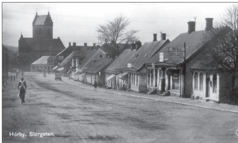
Barnmorska på uppdrag. Storgatan i Hörby på 1910-talet. En gata som både var gruslagd och stensatt om vartannat.