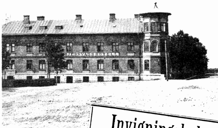
Ovan till vänster: Gästgivare Johan Nilsson. Ovan till höger: Järnvägshotellet. Till höger: Annons i Eslövs Tidningar angående Invigningsbalen.

Invigningsbal i Hörby. Till följe invigningsbal af nya Hotellet i Hörby anställes söndagen den 11 januari kl. \frac{1}{2} 7 e. m. Bal med Souper. Entrée 4 kronor för Herre " 3 " " Dam. Musiken utföres af en Militärsextett. (Tr. o. 3.)