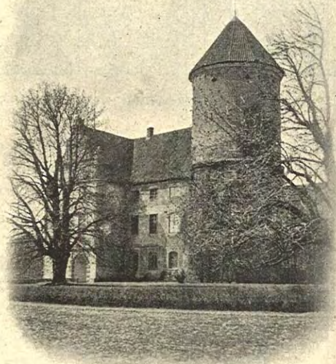
SKARHULT FRÅN NORDOST.