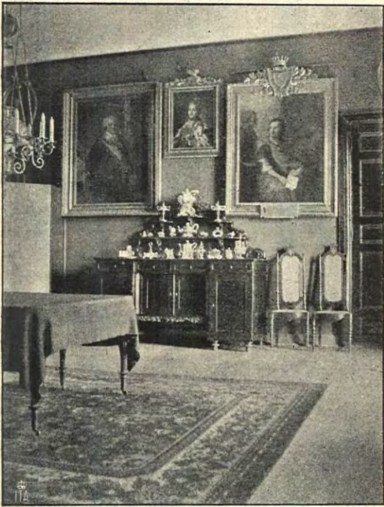
MATSALEN MED REUTERHOLMS M. FL. PORTRÄTT.

danskar ha kommit öfver till Skarhult och erbjudit sig att framdraga skatten mot hälftenparten däraf. Brahe afslog dock anbudet. Skatten finns sålunda kvar ännu och ger anledning till spökerier. Så har brandvakten ofta sett en svart hund vid midnattstid springa öfver gården, och om vinternätterna hör man stundom en järndörr slås igen med buller och dån, ehuru ingen sådan finns i borgen.