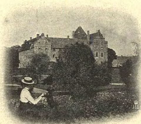
SKARHULT FRÅN SÖDER.

Byggnaderna på Skarhult hafva alla — utom ofvannämnda torn, som består af sju våningar — en höjd af tre våningar, med branta kroppastak och hvälfda källare under en del af mellanbyggnaden och hela östra flygeln. Denna senare bildar hufvudfasaden. Den har de rikaste ornamenten och de tjockaste murarna.