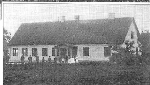
Lyby Folkskola i då- och nutid.

En svartmålad äggkorg med röda blommor stod på affärens trappa, när handelsfrun öppnade på morgonen, och då visste hon vem som ställt den där. På hemvägen hade jag varor i korgen. Från Johan Jönssons gård hade jag dessutom lärarens fulla mjölkspann på morgonen och tom på hemvägen. Det fick jag tjugofem öre i veckan för. Sedan hade jag ingen ledig hand till övers för att "laaja" Svea med.