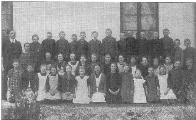
Samtliga fem klasser år 1925.